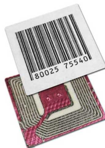
Sistema di etichetta antitaccheggio

Il vantaggio di avere un unico elemento identificativo (etichetta EAS) è da ricercare nella ottimizzazione del processo di applicazione dell'etichetta e nell'estetica del packaging.